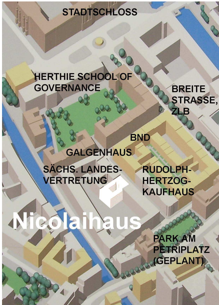
Abb. 7 (bearbeitete Fotografie eines Stellwandausschnittes an der Baufeldfreimachungsmaßnahme am Petriplatz): Weiß kenntlich gemacht wurde das Nicolaihaus in der Mitte. Es zeigt sich die unmittelbare Nähe zur Breiten Straße, zur Herthie School of Governance, sowie zum zukünftigen Stadtschloss.

Aufklärung die reichhaltige Geistesgeschichte des 18. Jahrhunderts für das 21. Jahrhundert darzustellen, als das Nicolaihaus? Vertreter der Aufklärung, des Sturm und Dranges, des Literaturlebens und der Philosophie, der Politik und der Naturwissenschaften stünden hier in einem erlebbaren Zusammenhang, von Lessing, Mendelssohn und Nicolai, über Friedrich II. und seine Nachfolger bis hin zu Kant, Herder, Goethe und Schiller. Ein solches Museum bedeutete, einer Öffentlichkeit, die nach mehr als 200 Jahren Schwierigkeiten hat, sich auf das 18. Jahrhundert einzulassen, entgegen zu kommen.