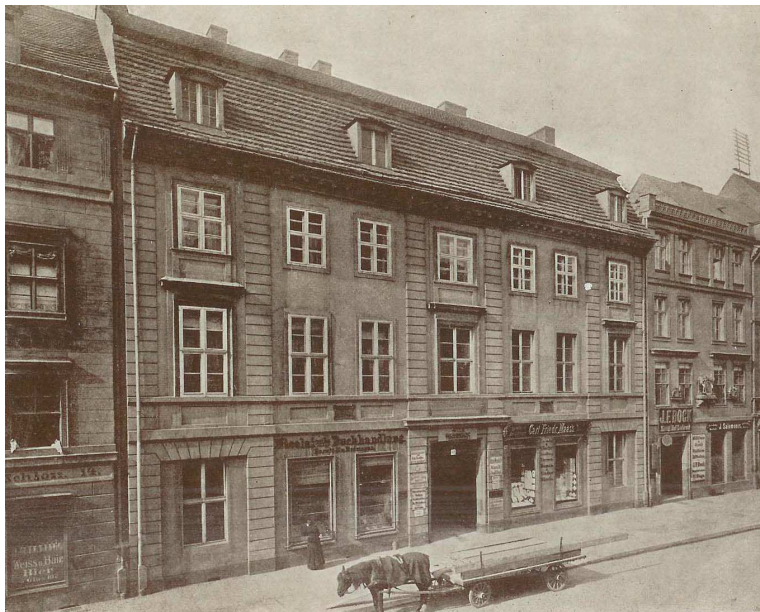
Abb. 1: >Das historische „Nicolai-Haus“ in der Brüderstraße 13<, Fotografie um 1892.

Indes ist die Empörung der Kenner dieses Hauses und der Berliner Geistesgeschichte untereinander und im Stillen groß. Allein - beantwortet werden ihre Klagen und das Einfordern von Engagement auf Seiten der Stiftung, in deren Obhut sich das Haus noch befindet, nicht.