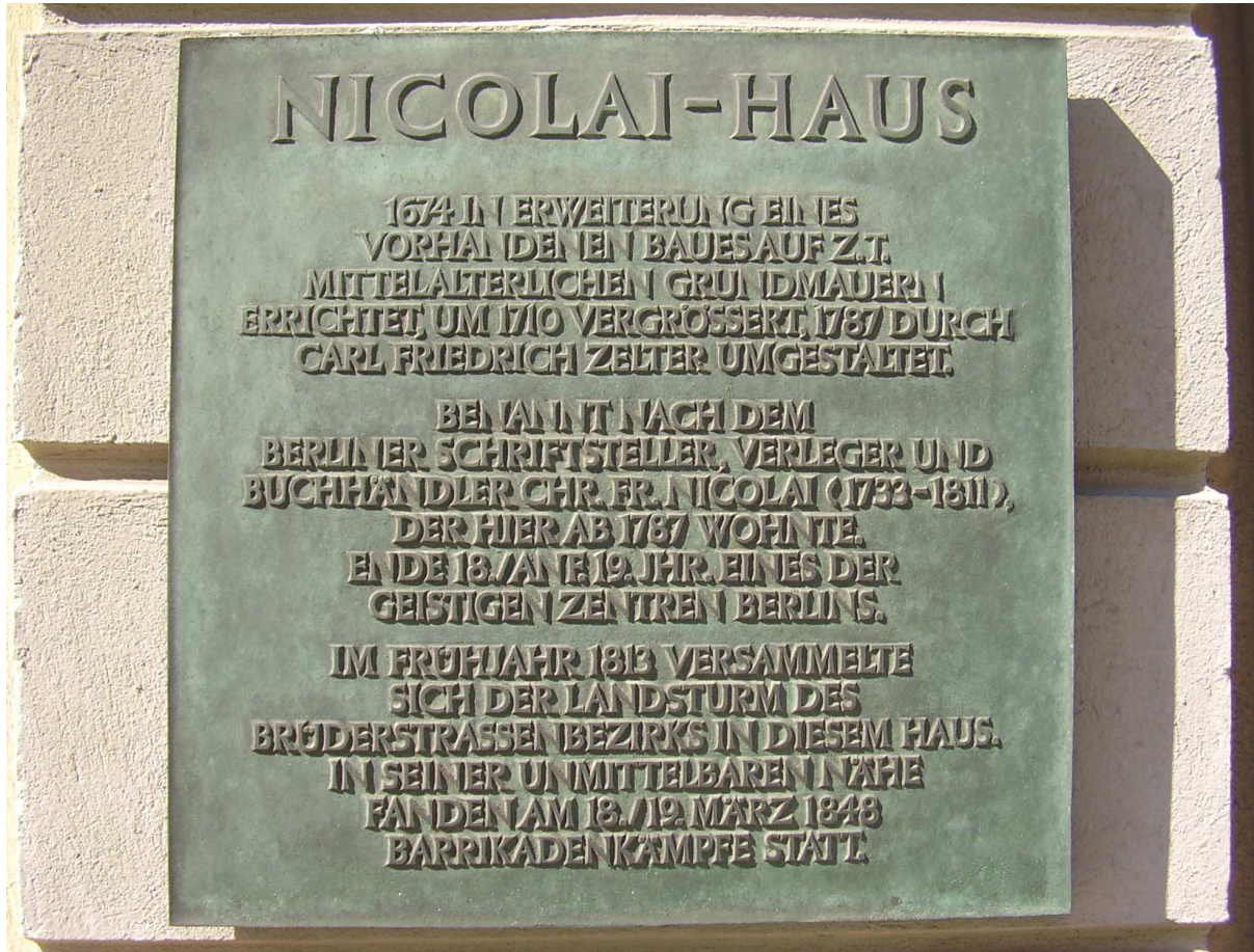
Abb. 5: Die links vom Eingang befindliche Tafel. Sie wurde 1928 vom Magistrat der Stadt Berlin angebracht.

Mit Gedenktafeln wurde bei dem Gebäude wahrlich nicht geizt, achtmal wurden sie seit 1928 angebracht und erinnern an Besitzer und Bewohner. Es sind die Stadt Berlin während der Weimarer Republik, der Ost-Berliner Magistrat in der Nachkriegszeit und schließlich der Senat des wiedervereinigten Berlins, die sich bis ins neue Jahrtausend hinein anstellten, dem ehrwürdigen Gebäude ihre Aufwartung zu machen. xi