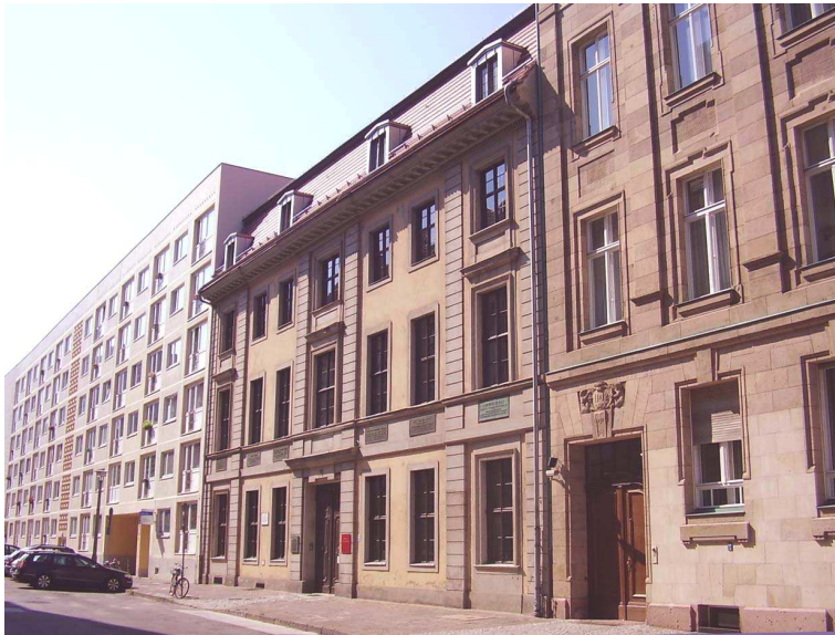
Abb. 2: Aktuelle Ansicht, rechts vom Nicolaihaus ist das angrenzende Gebäude der Vertretung des Freistaates Sachsen beim Bund zu erkennen, links ein größeres Wohngebäude.

Der bisherige Umgang mit dem Nicolaihaus zeugte von einer Auffassung des musealen Betriebes, wie sie etwa im Märkischen Museum praktiziert wird. - Kein Museum kann derart reichhaltig und überwältigend Berliner Geschichte darstellen wie das Märkische Museum, dem Tausende von Besuchern fehlen, weil es schlichtweg verkannt wird. - Das Nicolaihaus aber ist kein Regionalmuseum, seine Wirkungsgeschichte bezieht sich auf Deutschland.